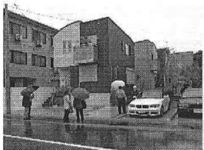
◀入居中の現場も見学