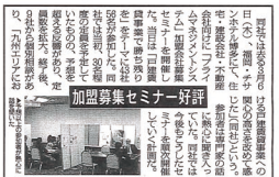
▲「F C事業で勝ち残り」 「F C事業で勝ち残り」

「従来の賃貸市場は、大手企業に集中していましたが、最近では中小企業も積極的に参入しています。その中でも、F C事業は、大手企業だけでなく、中小企業も積極的に参入しています。その中でも、F C事業は、大手企業だけでなく、中小企業も積極的に参入しています。」